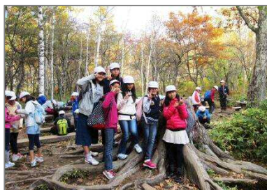
戦場ヶ原ハイキング