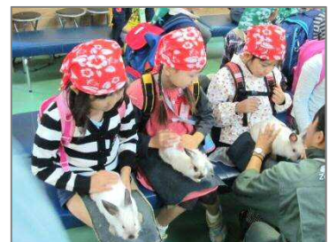
1年遠足：動物とのふれ合い