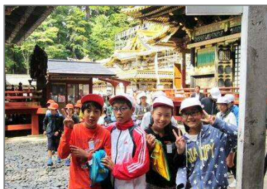
修学旅行：日光東照宮

21日、1年生にとって小学校で初めての遠足「東武動物自然公園」に行ってきました。ウサギやヒヨコなど小動物とのふれあいを体験し、生き物の温かさを肌で感じました。またホワイトタイガーやライオンの迫りに驚き、象の大きさに圧倒されました。青空の下で友だちとお弁当を広げたり、バス内で係が先生と協力してレクを楽しんだり、学校では得られない貴重な体験をたくさん積んできました。